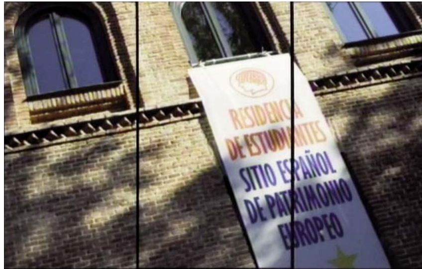
Fotogramas de documental 100% Residencia. Una tradición recuperada integrada en la exposición